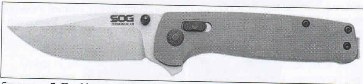
Зображення 7. Графічне зображення складаного ножа моделі «TERMINUS XR» виготовленого під торговою маркою «SOG» (Тайвань), наведеного у інформаційному джерелі [2].

Перевіркою відповідності розмірних та інших конструктивних особливостей досліджуваного ножа техніко-криміналістичним вимогам, визначеним «Методикою...» [1] встановлено, що наданий ніж не відповідає загальним техніко-криміналістичним вимогам до клинкової холодної зброї, а саме: товщина клинка, менше як 90 мм. Наданий на дослідження ніж не має технічної забезпеченості для ураження цілі.