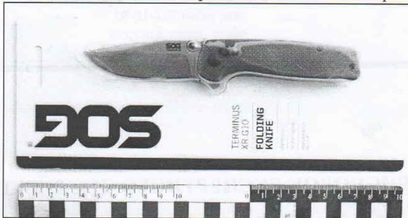
Зображення 1. Вид упаковання.

Ніж надійшов на дослідження упакованим в фірмове упаковання. На упакованні наявний напис «SOG». Вид коробки показаний на зображенні 1.