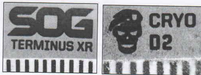
Зображення 4,5. Маркірувальні позначення на клинку.

Клинок ножа виготовлений з металу світло-сірого кольору, що притягується постійним магнітом. Довжина клинка 75 мм, найбільша ширина 25 мм, товщина 2,7 мм. Клинок має одне лезо з двосторонньою симетричною заточкою. Кут загострення леза складає 12^\circ (розраховано математичним шляхом). Обух клинка має скіс довжиною 57 мм. Вістря клинка утворене сходженням закруглення леза до скосу обуха. Кут загострення вістря 46^\circ . П'ята клинка фігурної форми, має найбільші розміри: довжина 5 мм, ширина товщина 2,7 мм. На обусі наявна пилка довжиною 23 мм. Клинок ножа в розкладеному стані фіксується за допомогою двостороннього фіксатора типу «AT-XR». На клинку (з кожної з сторін) закріплені два виступи для відкривання клинка (приведення ножа в розкладений стан). На кожній з голоменей клинка наявні маркірувальні позначення: на лівій голомені: напис «SOG TERMINUS XR»; на правій голомені клинка: «CRYO D2» та зображення черепа. Клинок з'єднаний з руків'ям за допомогою вісі. Вид маркірувальних позначень показаний на зображеннях 4,5.